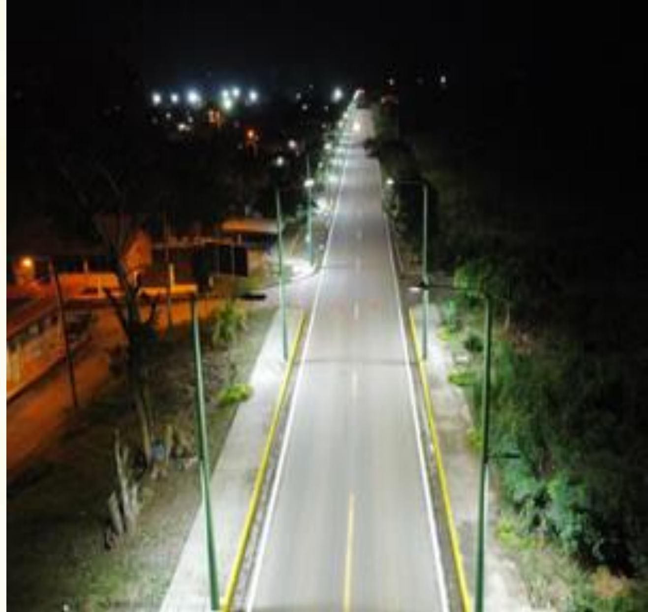
Inauguración la Obra de las Aceras e Iluminación de la Cabecera Parroquial.