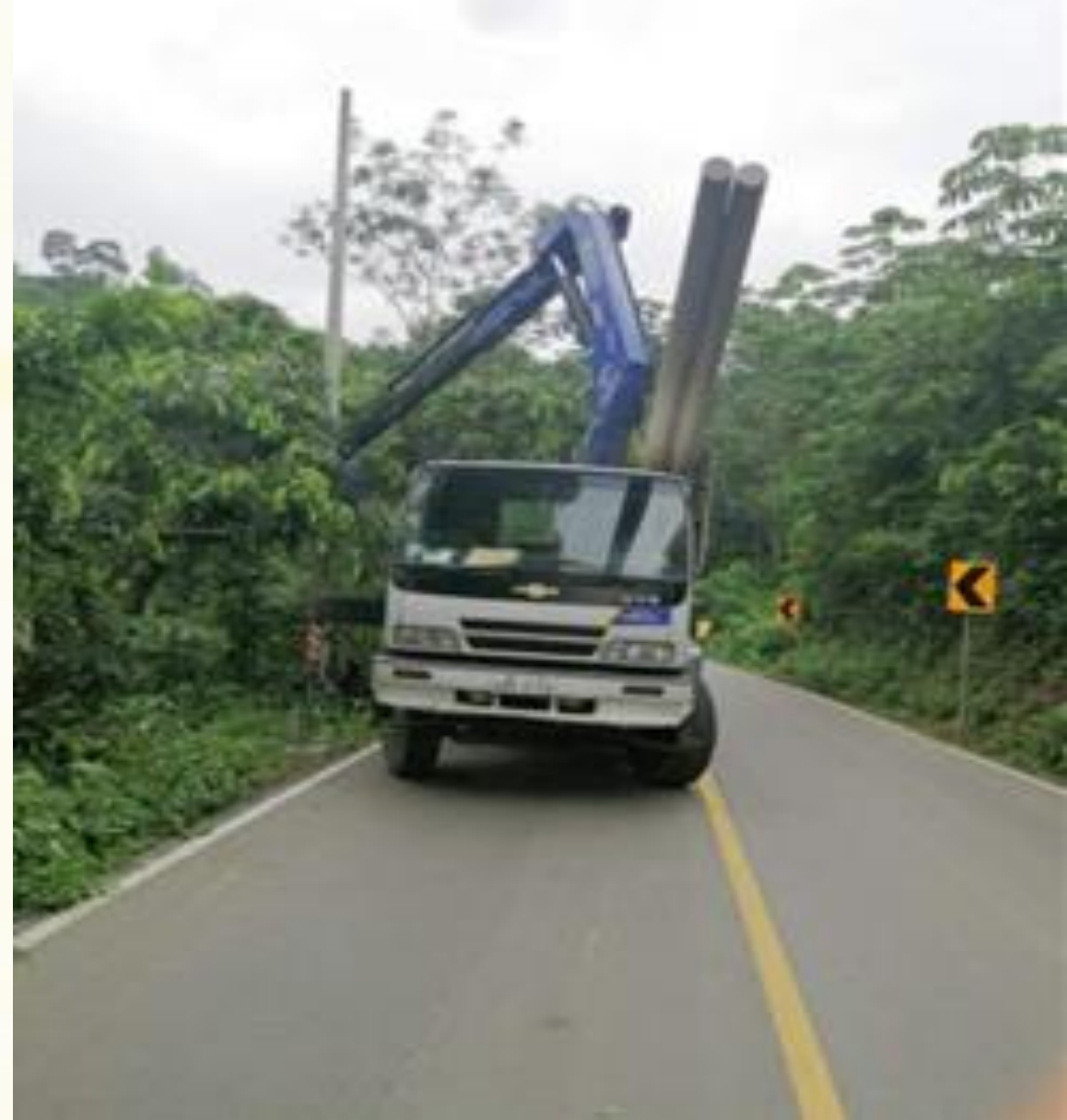
Fiscalización de la colocación de 30 postes de alumbrado público en sitio San Carlos.