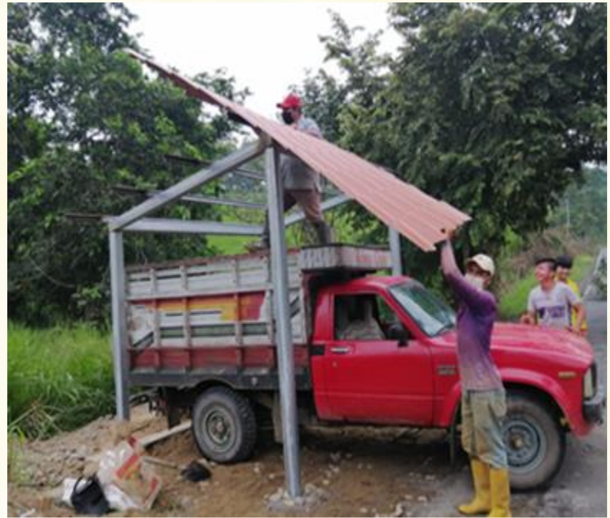
reparación y mantenimiento del paradero de los Sitios El Recreo, Valle Hermoso, la Piriguiña.