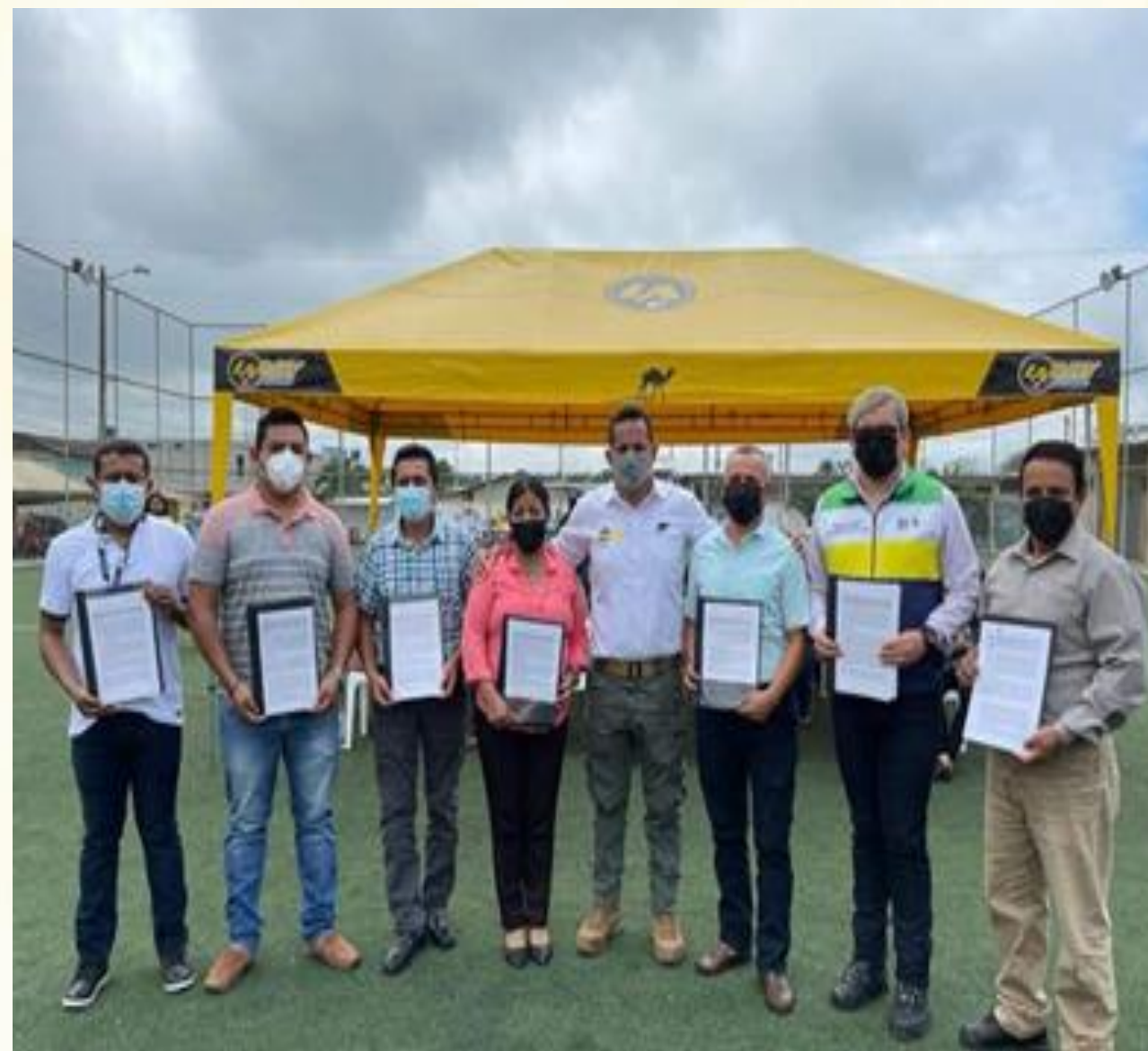
Firma de convenio para la ejecución del proyecto de atención a Adultos Mayores en la parroquia Bellamaria.