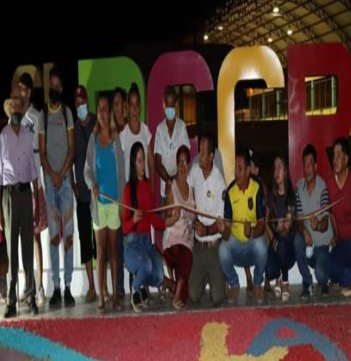
Gestion para la elaboracion de las letras corpóreas para el Sitio El Recreo, las mismas que fueron ubicadas.