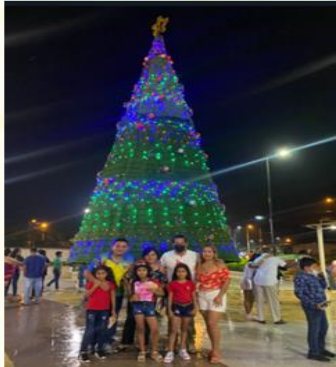
Entrega de juguetes y caramelos a los niños, y el encendido del árbol de navidad.