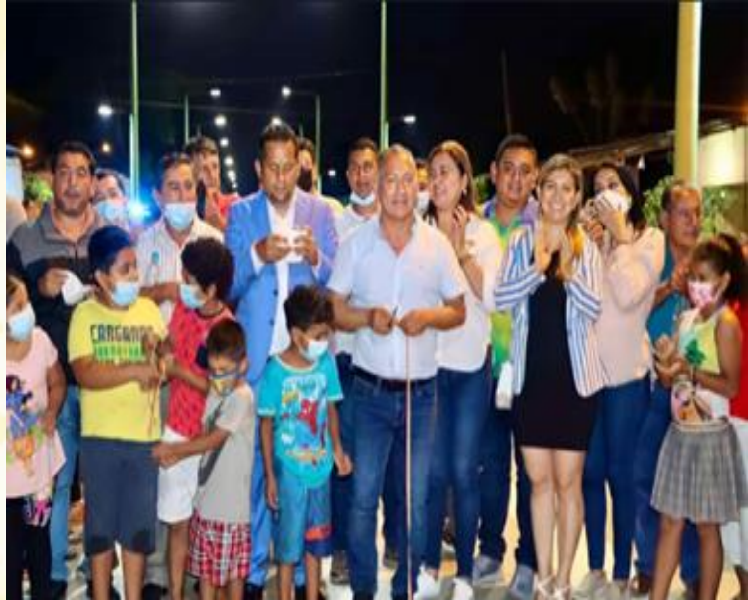
Entrega de la obra, asfaltado de la vía Santa Rosa - Bellamaría - Valle Hermoso, obra que entregó la Prefectura del Oro.